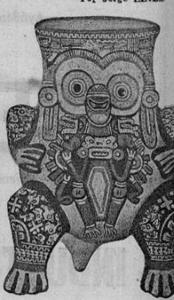
ESBOZO ARQUEOLÓGICO DE COSTA RICA Por Jorge LINES

el istmo de Rivas y orillas del lago del mismo nombre, extendiéndose a través de nuestros límites, sobre el istmo de Rivas y orillas del lago