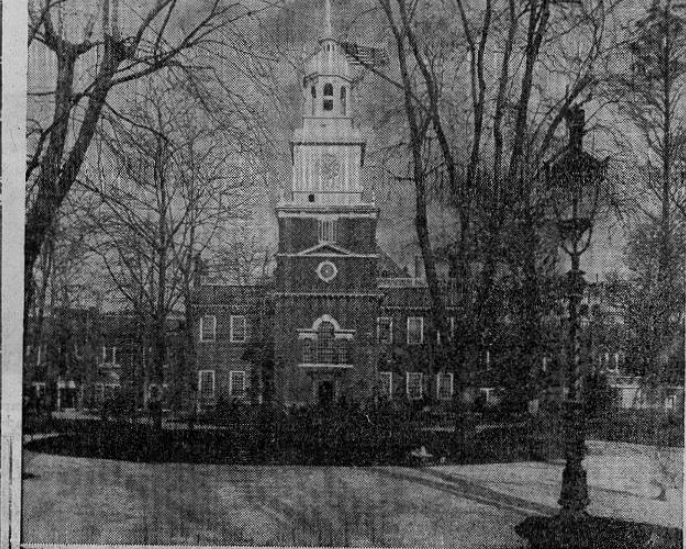
La casa en donde se firmó en Filadelfia, el 4 de julio de 1776, la Declaración de Independencia de los Estados Unidos, la primera colonia del nuevo mundo que luchó con éxito por el consiguimiento de su independencia absoluta.

En homenaje al querido país, publicamos a continuación algunos datos que ponen de manifiesto el por qué de tal lugar, a la vez que ilustrarán al lector sobre hechos históricos y vida actual de los Estados Unidos